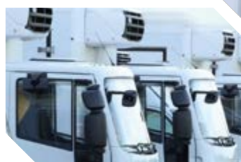
Gruppi frigoriferi dei veicoli di trasporto