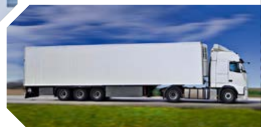
Veicoli di trasporto a temperatura controllata