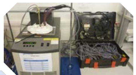
Registratori di temperatura